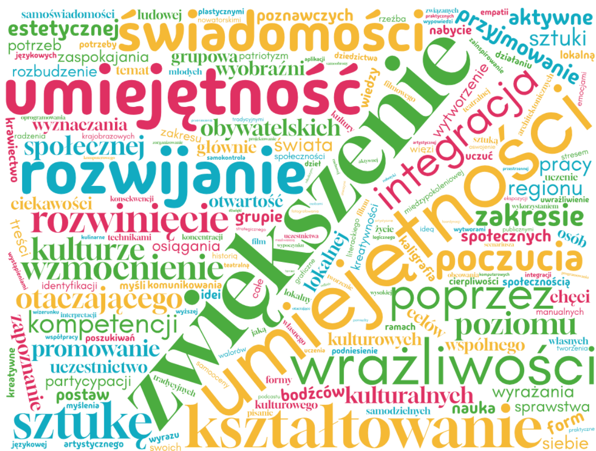
Rysunek 1. Kompetencje i umiejętności nabyte lub wzmocnione przez młodzież w ramach uczestnictwa w poszczególnych inicjatywach zrealizowanych w ramach Programu BMK w województwie podkarpackim w 2024 r. – chmura słów